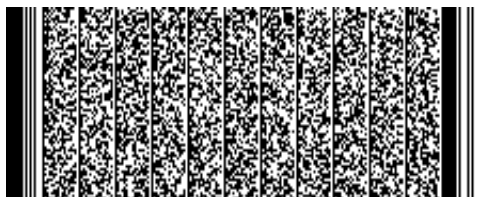
Timbre electrónico SRCEl

Verifique documento en www.registrocivil.gob.cl o a nuestro Call Center 600 370 2000, para teléfonos fijos y celulares. La próxima vez, obtén este certificado en www.registrocivil.gob.cl .