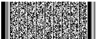
Timbre electrónico SRCel

Verifique documento en www.registrocivil.gob.cl o a nuestro Call Center 600 370 2000, para teléfonos fijos y celulares. La próxima vez, obtén este certificado en www.registrocivil.gob.cl .