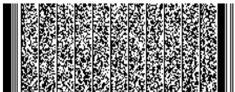
Timbre electrónico SRCel

Verifique documento en www.registrocivil.gob.cl o a nuestro Call Center 600 370 2000, para teléfonos fijos y celulares. La próxima vez, obtén este certificado en www.registrocivil.gob.cl .