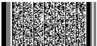
Timbre electrónico SRCel

Verifique documento en www.registrocivil.gob.cl o a nuestro Call Center 600 370 2000, para teléfonos fijos y celulares. La próxima vez, obtén este certificado en www.registrocivil.gob.cl .