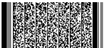
Timbre electrónico SRCel

Verifique documento en www.registrocivil.gob.cl o a nuestro Call Center 600 370 2000, para teléfonos fijos y celulares. La próxima vez, obtén este certificado en www.registrocivil.gob.cl .