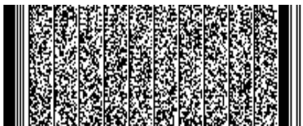
Timbre electrónico SRCel

Verifique documento en www.registrocivil.gob.cl o a nuestro Call Center 600 370 2000, para teléfonos fijos y celulares. La próxima vez, obtén este certificado en www.registrocivil.gob.cl .