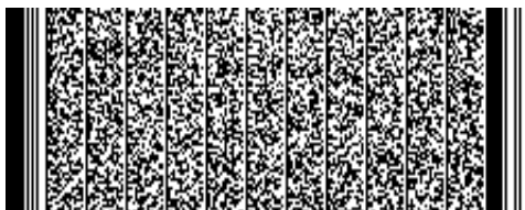
Timbre electrónico SRCel

Verifique documento en www.registrocivil.gob.cl o a nuestro Call Center 600 370 2000, para teléfonos fijos y celulares. La próxima vez, obtén este certificado en www.registrocivil.gob.cl .