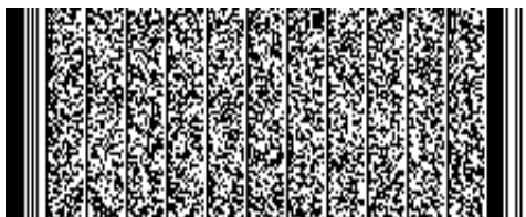
Timbre electrónico SRCel

Verifique documento en www.registrocivil.gob.cl o a nuestro Call Center 600 370 2000, para teléfonos fijos y celulares. La próxima vez, obtén este certificado en www.registrocivil.gob.cl .