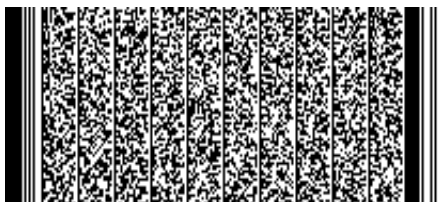
Timbre electrónico SRCel

Verifique documento en www.registrocivil.gob.cl o a nuestro Call Center 600 370 2000, para teléfonos fijos y celulares. La próxima vez, obtén este certificado en www.registrocivil.gob.cl .