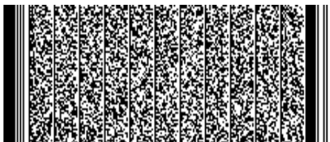
Timbre electrónico SRCel

Verifique documento en www.registrocivil.gob.cl o a nuestro Call Center 600 370 2000, para teléfonos fijos y celulares. La próxima vez, obtén este certificado en www.registrocivil.gob.cl .